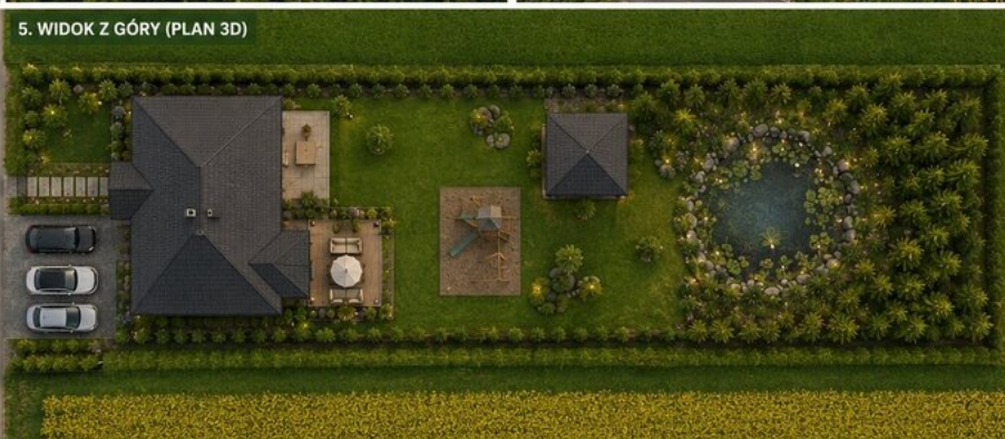
5. WIDOK Z GÓRY (PLAN 3D)