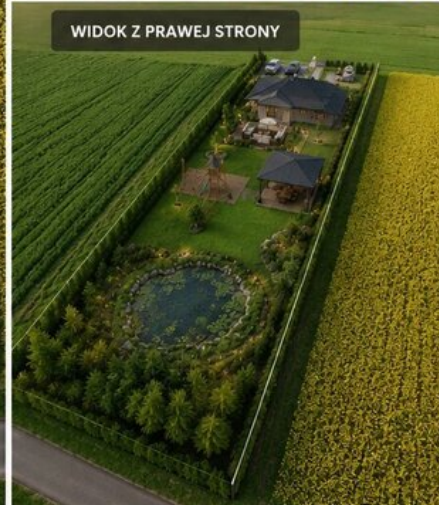
WIDOK Z PRAWEJ STRONY