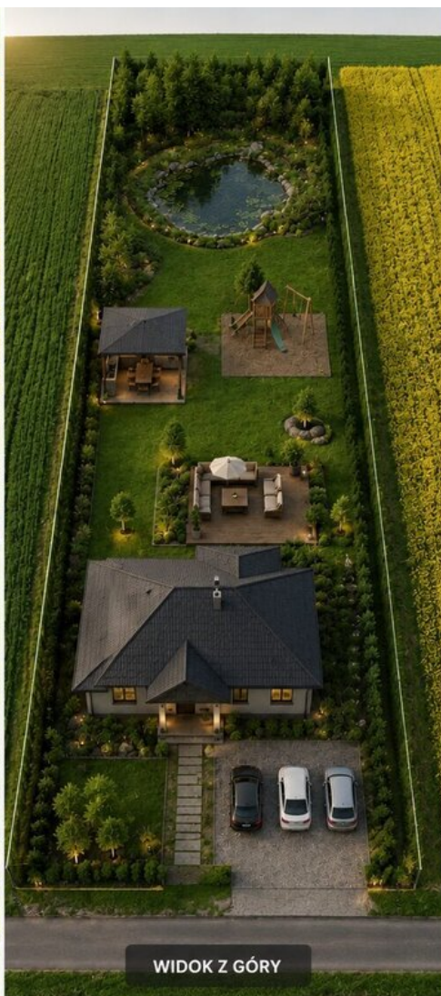
WIDOK Z GÓRY