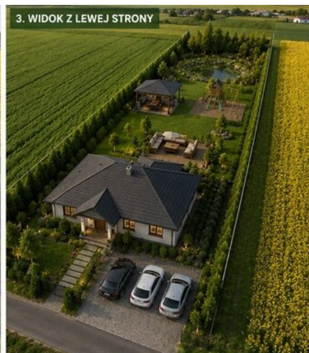
3. WIDOK Z LEWEJ STRONY