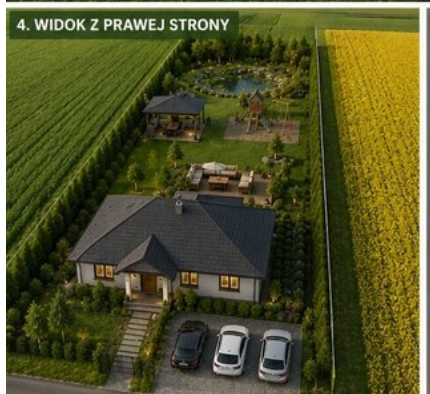
4. WIDOK Z PRAWEJ STRONY