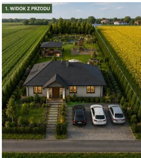
1. WIDOK Z PRZODU