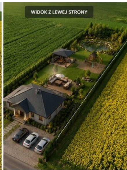
WIDOK Z LEWEJ STRONY