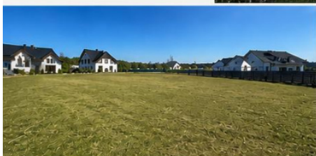
REGULARNY KSZTAŁT – ŁATWY DO ZAGOSPODAROWANIA