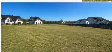
REGULARNY KSZTAŁT – ŁATWY DO ZAGOSPODAROWANIA