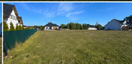
SĄSIEDZTWO NOWYCH DOMÓW