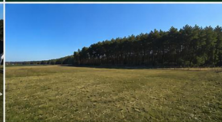
BLISKO LASU I TERENÓW REKREACYJNYCH