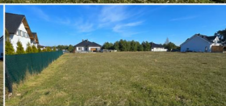
SĄSIĘDZTWO NOWYCH DOMÓW