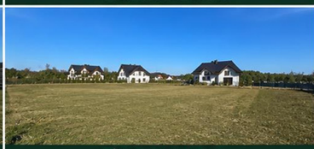
DUŻO PRZESTRZENI I ZIELENI