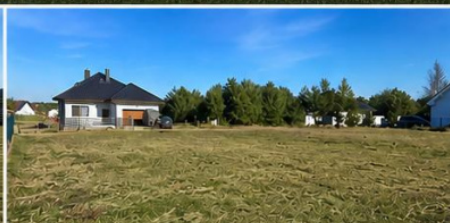
CICHA I SPOKOJNA OKOLICA