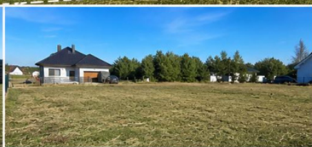
CICHA I SPOKOJNA OKOLICA