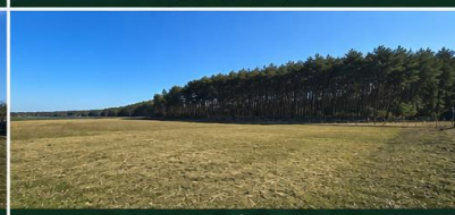
BLISKO LASU I TERENÓW REKREACYJNYCH